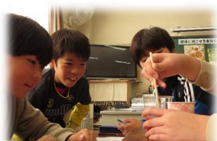
血管内に脂肪分がつく様子が、実験でとてもよくわかりました