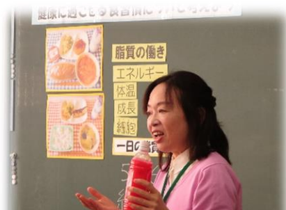
栄養教諭の先生が、わかりやすく授業をしてくださいました

今回の学習内容は、「健康に過ごせる食習慣を考えよう」。食事の中の脂肪分を予想したり、血管・血液に見立てた道具を利用して、脂肪で血管がつまる様子を実験で確認したりしました。その中で、油分の多い食事を食べ続けると、動脈硬化が起きることや、様々な病気にもつながることを学んでいきました。