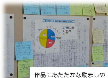
作品にあたたかな励ましや感想が寄せられています