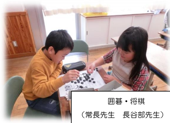
囲碁・将棋 (常長先生 長谷部先生)